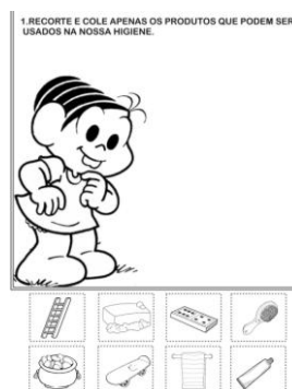
IMAGEM DA ATIVIDADE.

Na atividade de hoje vamos relembrar a HIGIENE PESSOAL o que usamos para realizar a nossa higiene no dia a dia como: sabonete, creme dental e outros. Agora observe as figuras abaixo do desenho da Mônica e recorte o que usamos para nossa higiene e cole no espaço indicado que é a frente dela, então vamos recortar com a tesoura contando com a ajuda da mamãe e colar.